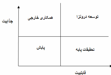
شکل ۱ ماتریس ارزیابی قابلیت - جذابیت [۱۱]

دسته اول، اطلاعاتی که به بررسی و شناسایی شاخه‌هایی می‌پردازد و باید برای گسترش و افزایش کارایی آن‌ها اقداماتی را اتخاذ کرد. دسته دوم، نیازمند بررسی قابلیت موجود در جهت نیل به وضعیتی مطلوب و محتمل در این شاخه‌ها است؛ از متخصصان و صاحب‌نظران تقاضا می‌شود تا به توانایی‌های موجود کشور امتیازدهی کنند. در دسته آخر به عوامل جذابیت پرداخته می‌شود و در آن وضعیت مطلوبی که باید به آن دسترسی پیدا کرد، بررسی می‌شود. برای بررسی از متخصصان تقاضا می‌شود تا به تمام این عوامل امتیازدهی کنند. از تجمیع این سه دسته از اطلاعات، ماتریسی استخراج می‌شود که می‌توان از آن اطلاعات مورد نظر را روی یک نمودار دو بُرداری استخراج کرد و در آخر برای تکمیل راهبرد از آن بهره گرفت (شکل ۱).