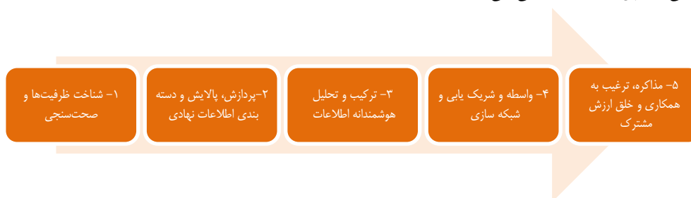
شکل ۱. معرفی فرایندها اجرای نهاد میانجی نوآوری

در نهاد متوالی در یک زنجیره ارزش، پارادیم جدیدی را ارائه داده و مدیران مجرب را قادر می‌سازد که از چندین دارایی یک نهاد برای حفظ و برقراری ارتباط با نهاد دیگر بهره جسته و قابلیت هم‌افزایی و مدیریت تعارض را بین دو نهاد و در یک زنجیره افزایش دهند. (مدیر ارشد صندوق نوآوری) از مجموع نظرات مصاحبه‌شوندگان مبین این است که شناخت دقیق از فرایندهای نهاد میانجی منجر به شناخت بهتر خلق ارزش مشترک می‌شود. از طرفی بازمهندسی این فرایندها و توانمندسازی نهادهای میانجی برای اجرای بهتر و اثربخش این فرایندها به توسعه و تقویت زیست‌بوم‌های تخصصی می‌انجامد. بر اساس برداشت آزاد از نظر مصاحبه‌شوندگان، فرایندهای اصلی نهاد میانجی مطابق شکل ۱ معرفی می‌شود.