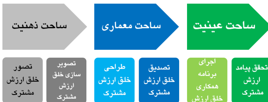
شکل ۳. فرایند شش مرحله‌ای خلق ارزش مشترک

مطابق یافته‌های پژوهش، تفاوت فیما بین خلق ارزش مشترک و معاملات متعارف بشرح جدول ۳ می‌باشد.