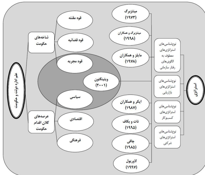
شکل ۱ نقشه ادبی پژوهش