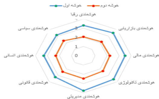
شکل ۱. وضعیت ابعاد هوشمندی رقابتی در خوشه‌های شرکت‌های دانش‌بنیان

به منظور انتخاب ویژگی‌های تأثیرگذار بر متغیر هدف از سه روش انتخاب ویژگی ریلیف، سود اطلاعاتی و الگوریتم ژنتیک استفاده شد و با توجه به اینکه مدل ساخته شده با روش ریلیف از دقت بالاتری برخوردار بود تنها نتایج مربوط به این روش آورده شده است. در روش انتخاب ویژگی ابتدا وزن تمام ۵۹ متغیر تأثیرگذار بر متغیر هدف محاسبه شد و سپس ۲۰ متغیری که بیشترین وزن را در بین متغیرها به دست آورده بودند به عنوان متغیرهای تأثیرگذار بر هوشمندی رقابتی در نظر گرفته شدند. جدول ۶ هر یک از متغیرها به همراه وزن و وضعیت آن‌ها از نظر انتخاب در مجموعه داده نهایی را نشان می‌دهد.