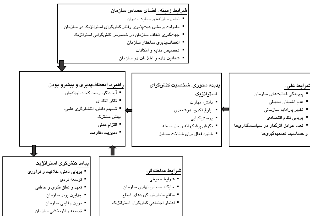
شکل ۱. الگوی پارادایم رفتار کنش‌گرای استراتژیک کارکنان

استراتژیک عبارت‌اند از رفتارهایی که با واکاوی استراتژیک، تولید ایده‌های نوین و فراهم‌سازی بسترهای لازم برای پیاده‌سازی آنها در پی ایجاد تغییر در استراتژی‌های سازمان به‌منظور همراستایی، مقابله و یا تناسب با محیط خارجی هستند و سعی در افزایش اثربخشی عملکرد خود و سازمان دارند [ ۶۶۲-۶۳۳: ۱۴]». بنابراین مفاهیم و ارتباط عناصر مدل رفتار کنش‌گرای استراتژیک در سازمان در پرتو این تعریف طراحی و سازماندهی شده است. همچنین از سویی، سازمان مورد مطالعه یک سازمان حاکمیتی در سطح محیط ملی و بین‌المللی کشور است و از سوی دیگر افراد منتخب در سازمان کنش‌گران کلیدی و استراتژیک در ساختار سازمان محسوب می‌شوند، تجربه‌ها، مصادیق و مباحث ارائه شده توسط ایشان عملکرد معمول و سازمانی و تخصصی ساده نبوده، بلکه رفتار متفاوت و استراتژیک است و نتایج حاصل نیز برای فرد و سازمان تعیین‌کننده بوده است. بنابراین ماحصل این‌گونه رفتار، پدیده محوری که توسط افراد کنش‌گر استراتژیک رخ می‌دهد و پیامدهای حاصل آن، هم‌معنا با تعریف رفتار کنش‌گرای استراتژیک است. چارچوب مدل نیز بر این اساس کدگذاری، مفهوم‌سازی و طراحی شده است.