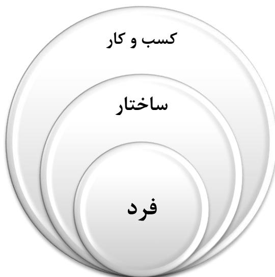
شکل ۳. الگوی مفهومی پژوهش (یافته‌های پژوهش)

ماندن در این فضای رقابتی نیازمند همکاری‌های دوجانبه یا چندجانبه هستند که در بستر پیمان استراتژیک تعریف می‌شود [۵۶]. بر اساس جدول ۵ یکی از شاخص‌های مهم شهرت شریک است. شهرت برای قابلیت اعتماد و شایستگی، یک دارایی استراتژیک مهم است و در طول زمان انباشته می‌شود [۱۷]. شهرت خوب نشان‌دهنده کیفیت یک شرکت است و سایر شرکت‌ها را تشویق می‌کند تا با آن متحد شوند. در مقابل، شرکت‌هایی که شهرت بدی دارند، احتمالاً فرصت‌طلبانه رفتار می‌کنند و کار کردن با آن‌ها دشوار است. از این رو شهرت یکی از عوامل کلیدی برای پایداری آینده و اجرای موفقیت‌آمیز یک پیمان خواهد بود. شهرت منبع مهم اعتماد متقابل است، زیرا به کاهش هزینه‌های مبادله، به حداقل رساندن رفتارهای فرصت‌طلبانه بالقوه، کاهش تعارضات بین شریک و کنترل ریسک‌های رابطه کمک می‌کند [۱۲]. بر اساس این سه بعد، الگوی مفهومی پژوهش را می‌توان به صورت زیر ترسیم نمود: