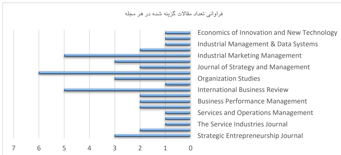
نمودار ۲. فراوانی تعداد مقالات نهایی گزینش شده

در این مرحله به بررسی تحلیل ۴۴ مقاله گزینش شده (بر اساس فیلترهای موضوعی) پرداخته شده است. در ابتدا و قبل از ورود به بخش مضامین اصلی ژورنال‌های چاپ شده این مقالات به شرح زیر است: