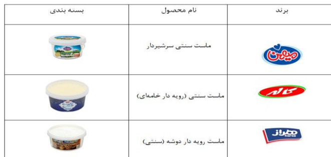
جدول ۲. نمونه بسته‌بندی انتخاب‌شده در پژوهش