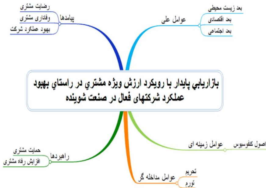
شکل (۱) الگوی عوامل مؤثر بر بازاریابی پایدار در صنعت شوینده

در مرحله کدگذاری محوری مرکزیت بیشتری دارند، به دست آید؛ دوم باید بیشترین فراوانی را در فرآیند کدگذاری نشان دهد. سوم همه ارتباطات با مقوله‌ها باید به طور خودجوش انجام شود [۳۴].