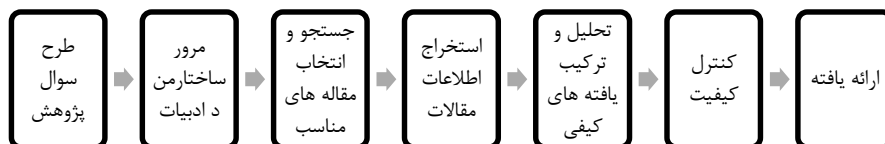
شکل ۱ مراحل روش فراترکیب