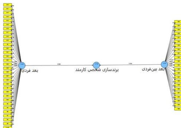
شکل ۱. مدل ساختاری (تحلیل مسیر) در حالت تخمین استاندارد