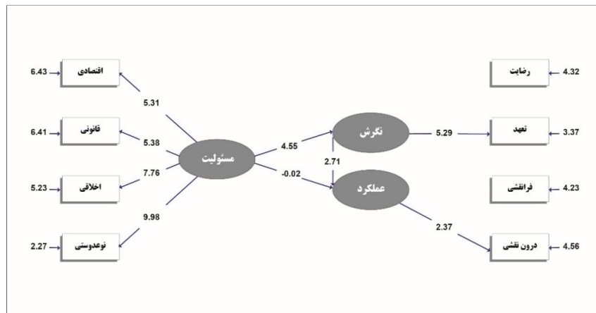
شکل ۲ مدل معناداری پژوهش

مطلوبی قرار دارند به طوری که مقدار کای اسکوئر نسبی کمتر از ۳، CFI و GFI بیش از ۰/۹، AGFI بیشتر از ۰/۸ و SRMR کمتر از ۰/۰۷ و RMSE کمتر از ۰/۰۵ است.