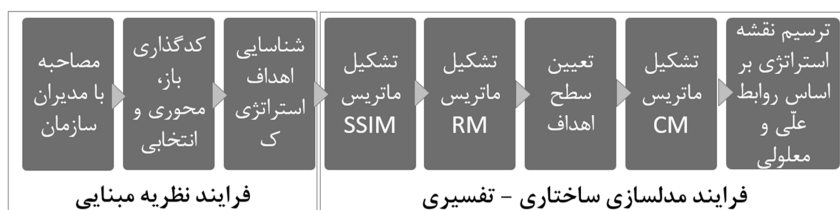
شکل ۱ فلوجارت مراحل اجرای تحقیق

است که آیا رابطه‌ای بین عناصر وجود دارد؟ و در صورت مثبت بودن جواب، ارتباط آنها چگونه است؟ از طرف دیگر مدلی ساختاری است، به این معنا که در آن بر مبنای روابط، ساختاری کلی از مجموعه پیچیده عناصر اقتباس می‌شود و در نهایت مدل‌سازی است؛ یعنی اینکه روابط عناصر و ساختار کلی در یک مدل گرافیکی مجسم می‌شود [۲۴، صص ۵۲ - ۵۹]. در اجرای تکنیک ISM، شش مرحله باید انجام شود. نخست به تعیین ابعاد / عناصر پرداخته و سپس ماتریس ساختاری روابط درونی ابعاد / عناصر (SSIM) به دست می‌آید. پس از آن ماتریس دستیابی استخراج شده و در مرحله بعد ماتریس دستیابی سازگار می‌شود. سطح‌بندی عناصر ماتریس دستیابی مرحله بعد است و در نهایت مدل ترسیم می‌شود. پرسشنامه این پژوهش به ۱۶ نفر از خبرگان ارسال شد. محقق با پیگیری‌های مکرر ۱۰ پرسشنامه تکمیل شده را دریافت کرد. برخی از خبرگان درباره پرسشنامه و نحوه پاسخ‌گویی به آن ابهاماتی داشتند که سعی شد در تماس تلفنی و یا مراجعه حضوری، ابهام‌ها مرتفع شود. مراحل اجرای این پژوهش در فلوجارت ذیل آمده است.