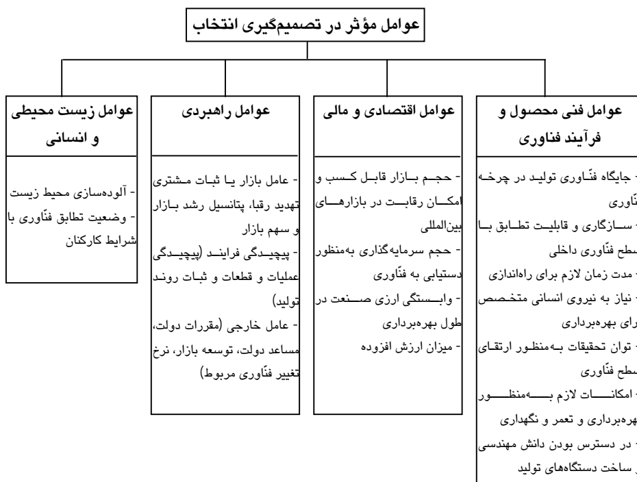
شکل 2 عوامل مؤثر در تصمیم‌گیری انتخاب

با توجه به اهداف و راهبرد کلان صنعت پارافین، می‌توان عوامل مؤثر بر این ابعاد را در شکل 2 به عوامل جزئی‌تر تقسیم کرد. با شناسایی این عوامل می‌توان آثار انتخاب هر گزینه را مورد تجزیه و تحلیل قرار داده، تحت مدلی به اتخاذ تصمیم پرداخت.