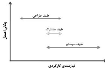
شکل ۱ طیف سیستم، طیف طراحی و طیف مشترک

با توجه به شکل ۱، مشاهده می‌شود که همپوشانی بین طیف طراحی و طیف سیستم، احتمال موفقیت یک سیستم در ارضای نیازمندی کارکردی مربوط به یک معیار را نشان می‌دهد (شکل ۱).