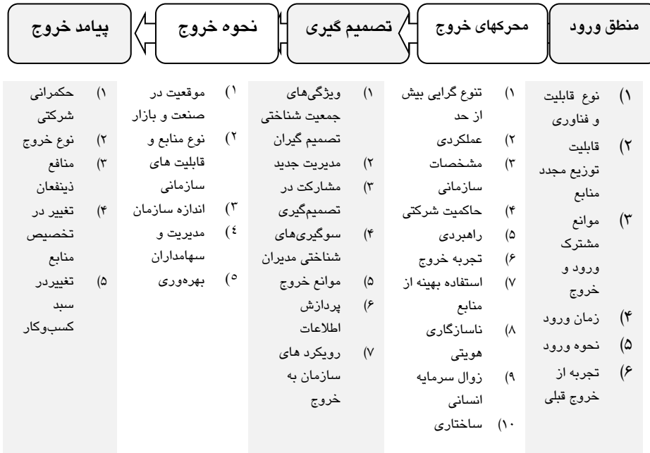
شکل ۲. چارچوب مفهومی فرایند خروج از کسب‌وکار

پاسخ این سوال که چرا عوامل یکسان که محرک خروج هستند منجر به پیامدهای خروج متفاوت می‌شوند را می‌توان در تصمیم‌گیری خروج جستجو کرد. مشارکت و جامعیت تحلیل در تصمیم‌گیری، قابلیت سازمان در پردازش و تحلیل اطلاعات درون و برون سازمانی، دلبستگی و سوگیری‌های شناختی مدیران و رویکرد منفعلانه و یا کنشگرایانه سازمان از عواملی هستند که بر تصمیم‌گیری سازمان در ارتباط با ادامه کسب‌وکار و یا خروج (به موقع) اثرگذار هستند. به عنوان مثال قابلیت سازمان در تحلیل اطلاعات درون و برون سازمانی (ممیزی داخلی قابلیت‌ها و رصد خارجی روندها) این امکان را به سازمان می‌دهد تا بررسی کند آیا سازمان شایستگی لازم را برای ادامه کسب‌وکار فعلی را دارد و یا به دلیل وجود فرصت‌های جایگزین در بازارهای دیگر بهتر است منابع خود را در کسب‌وکار دیگر سرمایه‌گذاری کند. پس از اینکه سازمان تصمیم به خروج گرفت نحوه خروج از کسب‌وکار مطرح می‌شود. بهره‌وری، موقعیت در صنعت و بازار، نوع منابع (منابع انسانی، مالی و فناوری) و قابلیت‌های