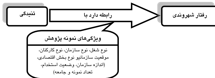
شکل ۲ مدل نهایی تحقیق

در این پژوهش، متغیرهای مربوط به ویژگی‌های نمونه که رابطه تنیدگی و رفتار شهروندی را متأثر ساخته‌اند، بررسی می‌شوند. این متغیرها شامل نوع شغل و بخش اقتصادی، اندازه و نوع سازمان و کارکنان، درجه توسعه یافتگی کشور، وضعیت استخدام، موقعیت سازمانی، تعداد نمونه و جامعه آماری می‌باشند. به تعداد این متغیرها فرضیه طراحی و آزمون انجام گرفت و در نهایت مشخص شد؛ نوع شغل، نوع سازمان، موقعیت سازمانی، نوع کارکنان و تعداد جامعه آماری رابطه تنیدگی و OCB را تعدیل نموده‌اند. البته از بین فرضیه‌های تأیید نشده نیز فرضیه‌های جزئی‌تر پذیرفته شدند که از جمله تفاوت اندازه اثر تنیدگی بر OCB-O، در دو بخش صنعت و خدمات، اثر اندازه سازمان بر رابطه تنیدگی عاطفی و OCB، اثر تعداد نمونه بر رابطه تنیدگی و OCB-O و اثر وضعیت استخدام بر رابطه تنیدگی و OCB-O می‌باشد. بنابراین با توجه به نتایج آزمون فرضیه‌ها مدل مفهومی پژوهش به شکل زیر نهایی می‌شود: