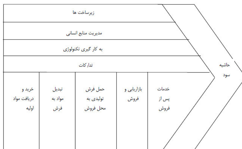
شکل ۲ زنجیره ارزش فرش

۲- فعالیت‌های پشتیبانی: فعالیت‌های پشتیبانی آن دسته از فعالیت‌هایی هستند که حول فعالیت‌های اصلی و برای آماده‌سازی شرایط اجرای آن‌ها انجام می‌شوند. با توجه به مطالب گفته شده می‌توان زنجیره ارزش صنعت فرش را به شرح زیر بیان نمود: